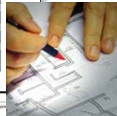
Professionell Planung – bis ins kleinste Detail.