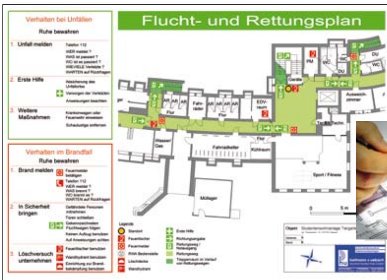
Flucht- und Rettungsplan