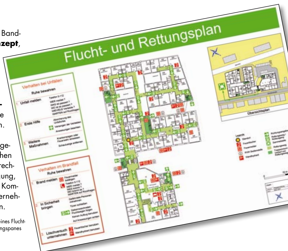
Beispiel eines Flucht- und Rettungsplanes

Für die unterschiedlichen Fragestellungen im Brandschutz stehen wir Ihnen als kompetenter Ansprechpartner jederzeit zur Verfügung, Planungsfehler durch fehlende Kommunikation werden für Ihr Unternehmen hierdurch ausgeschlossen.